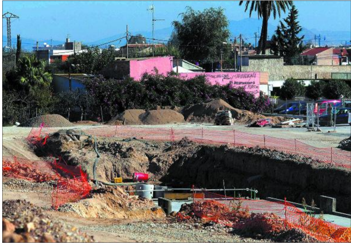
Las obras avanzan hacia la finca del matrimonio, enfrente y de color rosa.